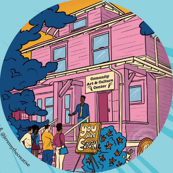
ኣርቶጋርክ ብጀ. ጊ. ዲ. @jeremythecreative

ብናይ ቀደም ጋዜጣታት ወይ ብናይ ባዕልኻ ስእልታት ጌርካ ናይ መጻኢኻ ራኢ ዝሓዘ ሰሌዳ ፍጠር። ኣብ መጻኢኻ ኣዚኻ እትሕጎሰሉ ነገር እንታይ እዩ? ናይ መጻኢ ሽቶታትካ፣ ተስፋታትካን ሕልምታትካን እንታይ እዮም?