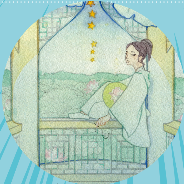
ኣርቶጋርክ ብዩ. ዱ. @authenticityi