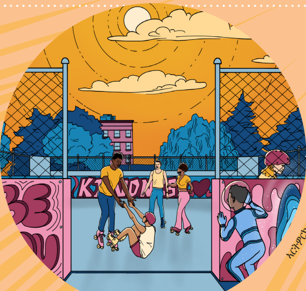
ኣርታዊቲ ብጽጊ ጥቁር @jeremythecreative