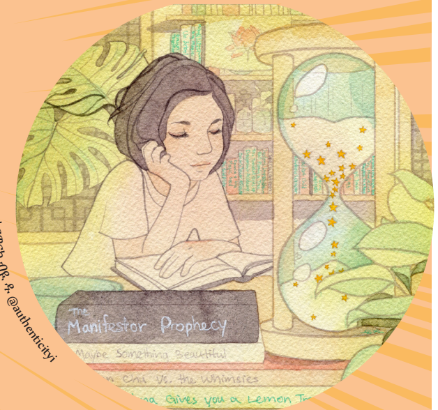
ኣርታዊቲ ብዩዳ @authenticity1

ናህትካ ጅግና መን እዩ? ንሳቶም ፍሉይት ዝገብሮም እንታይ እዩ? ንሰኻን እቲ ጅግናኻን ብኸመይ ትመሳሰሉ? ንሰኻን እቲ ጅግናኻን ብኸመይ ትፈላለዩ?