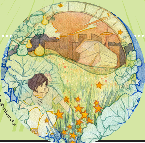
ኣርኮርካ ብኡዳ @authenticity