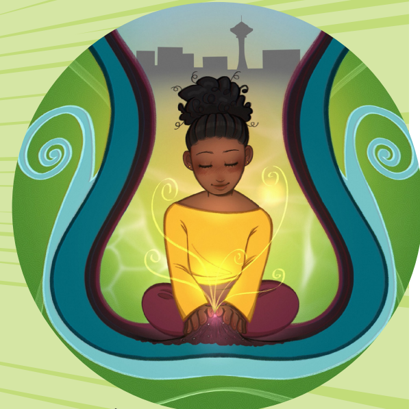
ኣርትዮርክ ብኢነስ ሮድሪኪዊዝ @neon_salsa

ነቲ ቐደም ትነብረሉ ዝነበርካ ዝገልጽ ናይ ቀደም ስእሊ ርኹብ። እንታይ ራኢኻ? ኣብቲ ስእሊ ዘሎ መን እዩ? ብዓል መን እዮም እሳቶም? ብኸመይ ፈሊጥካ? እቲ ስእሊ እንታይ ዓይነት ታሪኽ ይነግረካ?