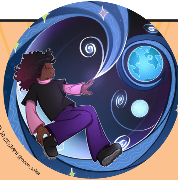
ኣርታዊቲ ብኢኮ ርድኒዳዎ! @neon_salsa